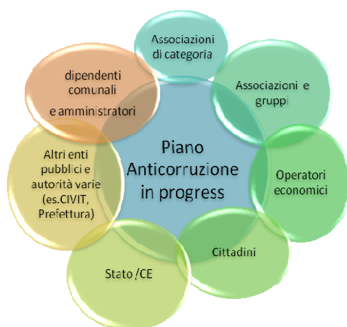
fig. 1 - Piano Anticorruzione Comunale e portatori di interessi

Il presente Piano, ed il suo aggiornamento, è stato oggetto di consultazione e partecipazione, attivata nel mese di novembre 2015 ( avviso recante la data del 20 novembre 2015 pubblicato all'albo pretorio online con scadenza del 18 dicembre 2015 ) con i portatori di interessi sia all'interno e che all'esterno della struttura amministrativa.